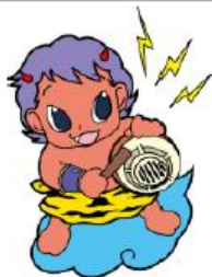
香川県住宅用火災警報器 PRキャラクター カジナリくん