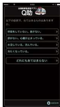
視覚効果 「明度反転」