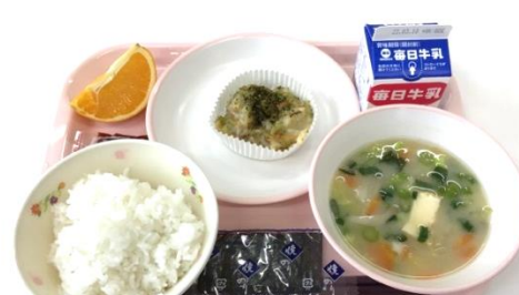
香川風お好み焼き