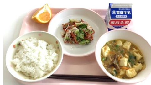
鶏肉と冬野菜の中華風ドレッシング