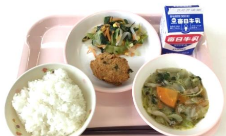
ミラノ風OIMOコロッケ