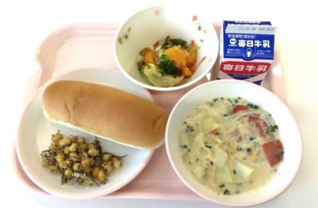
みかンドレッシングのサラダ