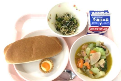
金時みかんのチーズタルト