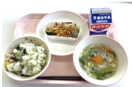
さつまいもと小松菜のごはん・ぽかぽかそうめん汁