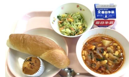
さつまいもとみかんのケーキ