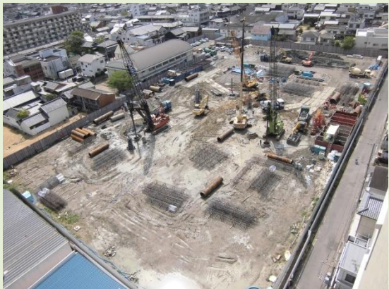
全体写真(病院北側より撮影)