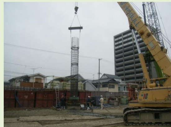
杭打ちは全74本中約60%完了