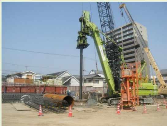
杭打ちに向けた掘削作業風景