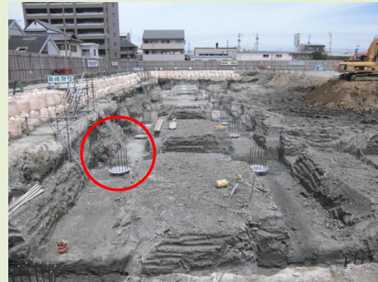
杭打ち後の杭頭処理を進めています