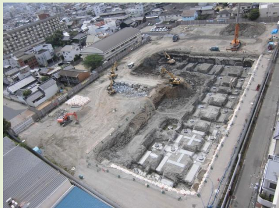
全体写真(病院北側より撮影)