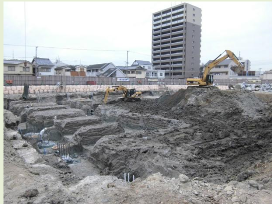
地下免震層の掘削は60%程度完了