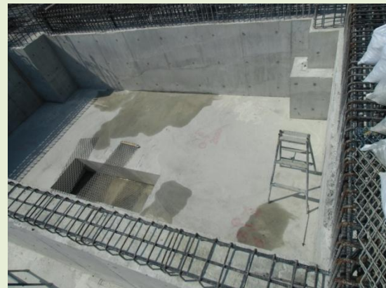
打設完了後の地下水槽の様子