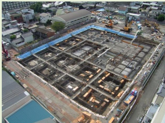
全体写真(病院北側より撮影)