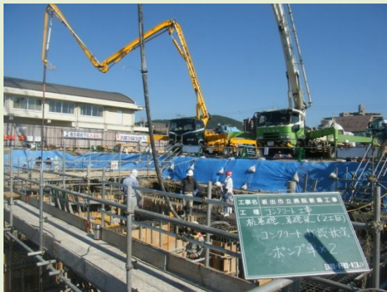
ポンプ車2台によるコンクリート打設