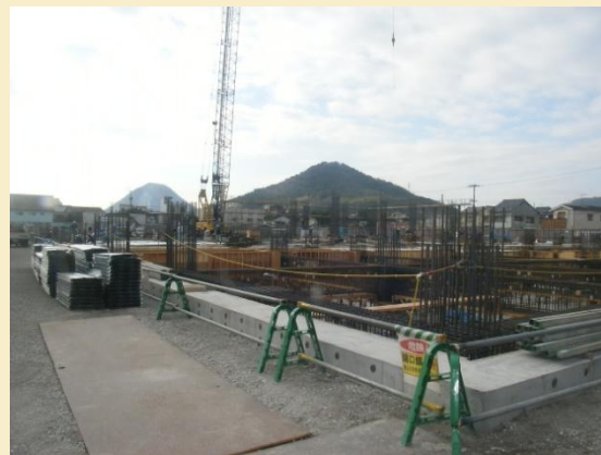
病院北東側からの現場写真