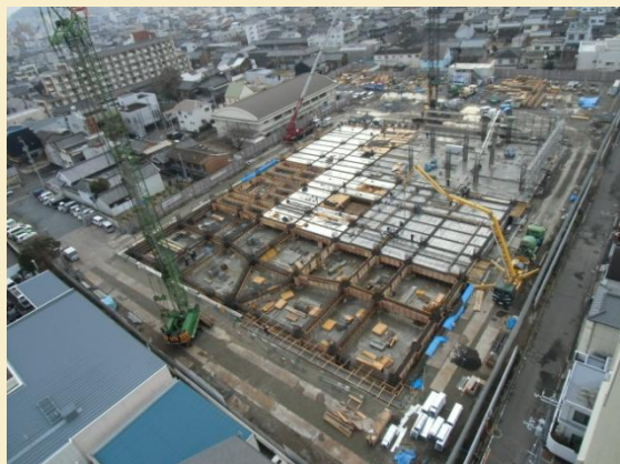
全体写真(病院北側より撮影)