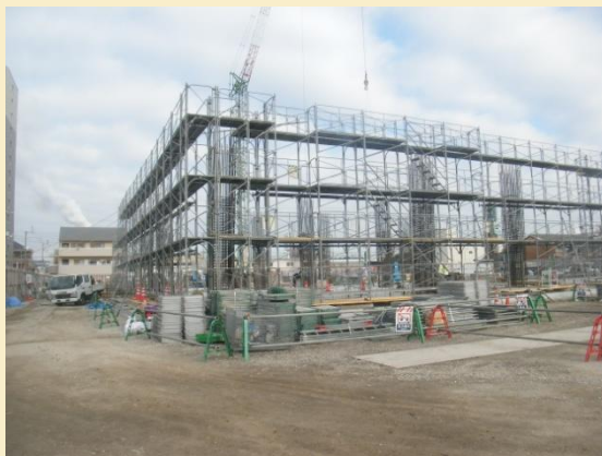
外部足場の組立状況