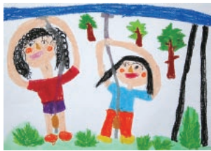
(ターザンロープたのしいな)