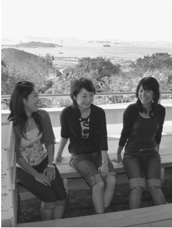
▲白峰パークセンター2階に設置された手づくりの足湯施設。