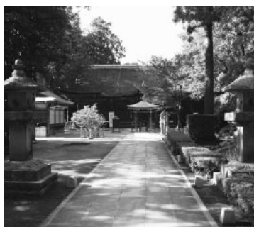
▲頓証寺殿。西行法師と相模坊天狗の石像が建つ。