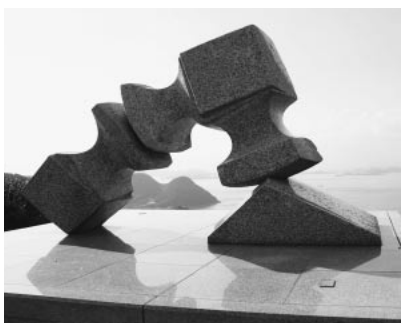
▲大崎山園地展望台に建つ彫刻「またきまい」（作者 流政之氏）

■お問い合わせは、市商工観光課（☎44・5015）へ 坂出市と高松市の境を南北に縫うように走る五色台スカイライン。四季を通じて五色台の豊かな自然を満喫できるドライブコース。しばらく北へ道なりに進むと三差路にさしかかり、左折すると五色台ビジターセンターと休暇村讃岐五色台がある。直進し、さらに北に進むとやがて前方に海が見え、瀬戸内海歴史民俗資料館が見えてくる。スカイラインの終点も近い。香川県立五色台自然センター自然科学館の方に左折すると、大崎山園地が広がる。展望台には流政之氏の彫刻「またきまい」が建つ。道に戻り、スカイラインを降りると大崎ノ鼻に行き着く。目の前に三角おむすび形をした大槌島と小槌島（手前）が現れる。西を望めば瀬戸大橋、北には岡山の山々も見渡せ、目の前では多くの船がゆつくりと行き交う。しばし、時間の経つのを忘れ、瀬戸内海の景色に見とれてみてはいかが。