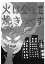
西部小6年 中原 百香