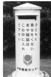
林田みなと緑地公園

平成18年度の回収状況は左記の表のとおりになっています。 当育成センターでは、青少年の健全育成活動の一環として今後もこのような環境浄化活動に取り組みたいと考えておりますので、市民のみならずご協力をお願いします。しかし、くれぐれも赤いポストとお間違えにならないようにお気をつけください。