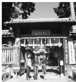
▲四国霊場81番札所白峯寺

る。全長1,340mの沿道には崇徳上皇や西行たちが詠んだ歌を刻んだ88基の歌碑と石灯籠が建ち並ぶ。片道は徒歩で約30分の道のり。保元文学にふれながらゆつくり歩いてみるのも楽しい。