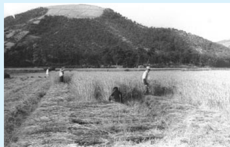
（昭和36年） 山下 文雄さん（林田町）より