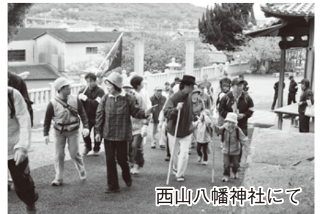
西山八幡神社にて

10月26日、ふるさとウォークが開催されました。市民美術館を出発した総勢約50人の一行は、西山八幡神社、角山テッペン広場、ビリケ井戸、州賀金比羅社、久米通賢墓碑など西部地区の名所・史跡を約3時間で探訪。健康増進に役立つ秋の1日となりました。