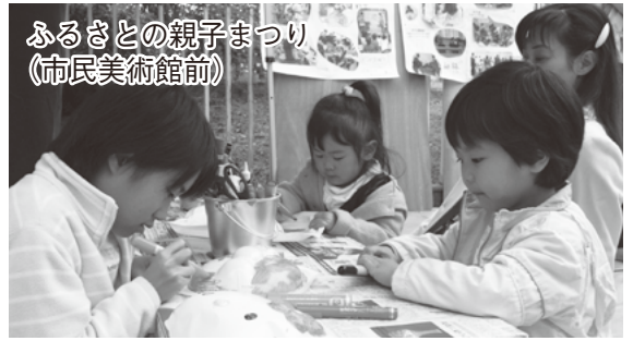
ふるさとの親子まつり (市民美術館前)