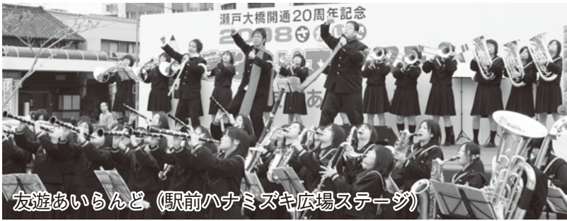
友達あいらんど。(駅前ハナミズキ広場ステージ)