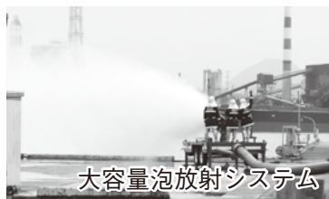
大容量泡放射システム

11月7日、コスモ石油(株)坂出製油所で県や市など防災関係機関の約400人が参加し、総合防災訓練が実施されました。防油堤内や屋外貯蔵原油タンクから火災が発生したとの想定。消防車による放水消火活動や、新規に導入された大容量泡放射システムの訓練が行われ、災害時の迅速かつ的確な活動の強化が図られました。