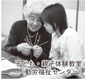
子ども・親子体験教室 (勤労福祉センター)