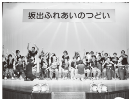
坂出ふれあいのつどい

9月23日、環境美化促進地域に指定されている、さぬき浜街道と駅前通りで、第43回キープ・クリーン運動が実施されました。西部、中央、東部、金山、林田支部の地区衛生組織のみなさんと市職員の総勢246人が参加。集まったごみは、トラック4台分になりました。