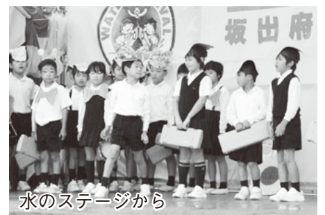
水のステージから

府中湖にて10月4日、いきいきウォークや三世代交流ドラゴンカヌー体験会等が、5日にはドラゴンカヌー大会等が開催されました。雨の中で行われたドラゴンカヌー大会には、遠くは静岡県からの参加もあり、県内外から62チームが白熱したレースを行いました。各部門の優勝は以下のとおりです。おめでとうございます！