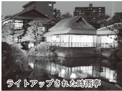
ライトアップされた時雨亭