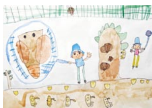
(せみがいっぱいにとれたよ!)