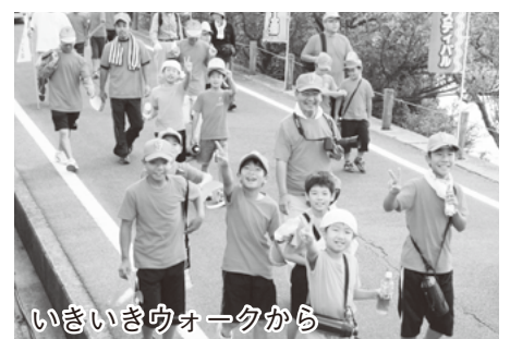
いきいきウォークから