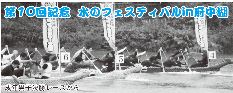
成年男子決勝レースから

10月1日、東部小学校で京都フィルハーモニー室内合奏団の公演が行われました。文化庁による本物の舞台芸術体験事業の一環で、音楽への興味と理解を深め、豊かな情操を養うのが目的。体育館に集まった児童や保護者等約550人は、迫力ある演奏に魅了されました。