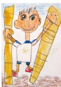
(もっともっと たけうまにのりたいたよ)