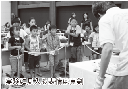
実験に見入る表情は真剣