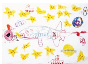
(宇宙人にあいたいなあ)