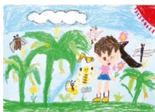
(とうもろこしがとれたよ!)