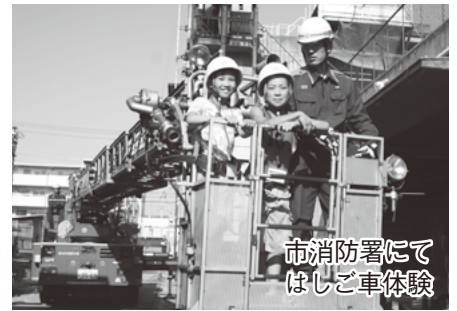
市消防署にて はしご車体験