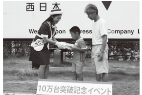
西日本 West Japan Press Company L 10万台突破記念イベント

7月20日、自主防災組織リーダー研修会が、勤労福祉センターで開催されました。参加したのは、自主防災組織、自治会、防災士等のかたがた。災害時に起こる問題を想定した二者択一のゲームでは、選択理由について議論が行われ、組織のリーダーとしての判断力の向上が図られました。