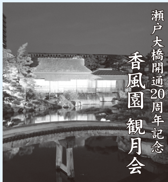
瀬戸大橋開通20周年記念

池泉回遊式日本庭園の「香風園」で、今年も観月会を開催します。ライトアップされた幻想的な雰囲気、漂う庭園の中で、中秋の名月を観ながら秋を感じてみませんか。 香風園では期間中、休憩所もあわせて開園時間を午後9時まで延長し、みなさまのお越しをお待ちしています。 日時 9月13日(土)～15日(祝)午後6時～9時 催し