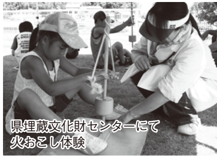
県埋蔵文化財センターにて 火おこし体験