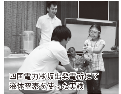
四国電力(株)坂出發電所にて 液体窒素を使った実験

7月25日、公募で集まった親子13組36人が、夏休み親子市政バスに参加しました。ふるさと坂出を親子でよく知ってもらおうと毎年夏休みに合わせて実施しており、今年も、四国乳業(株)坂出工場→県埋蔵文化財センター→瀬戸大橋記念公園→四国電力(株)坂出發電所→市消防署を見学しました。お忙しい中ご協力いただきましたみなさま、ありがとうございます。