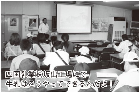
四国乳業(株)坂出工場にて 牛乳はこうやってできるんだよ!