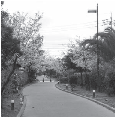
自転車歩行者道 (完成イメージ)

県道33号線から市道旭町5号線までの延長260mの区間を、災害時には避難路として、また一時的な避難場所としても利用できる防災機能を有した自転車歩行者道を幅員4mで整備するものです。地域の方からの提案をもとに詳細設計を行った結果、ソーラー照明灯や防災機能を有したベンチ等を設置した道路として平成26年度より工事に着手していきます。道路の維持管理については、公共施設里親制度等を活用した、地域の方々の共働による管理が望ましいと考えています。