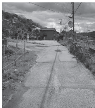
金山ニュータウン進入路周辺

このため、進入路周辺の整備については、現在事業を進めている京町線、室町谷内線の進捗を見極めた上で、都市計画決定の見直しも視野に入れ、整備区間の検討を行っていきます。