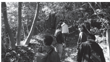
里山めぐりツアー

平成26年度早々に、国から、固定資産台帳の整備方針等が示される予定であることから、現在、地方公会計制度も視野に入れ、関係部局で整備を図っています。その整備方針等も参考として、基礎データをまとめて作成した資料を公表できるよう取り組んでいきます。