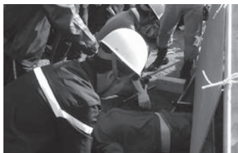
震災時対策避難防災訓練