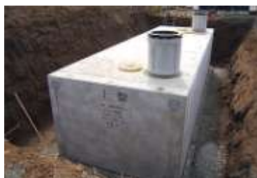
耐震性貯水槽のイメージ