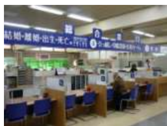
ローカウンターのイメージ