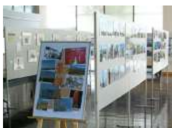
市民ギャラリーのイメージ