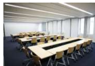
会議室のイメージ

(注1) ライフサイクルコスト：建物の計画に始まり，設計，建設，維持管理を経て，寿命がきて解体処分するまでを建物の生涯と定義し，その全期間に要する費用のこと。