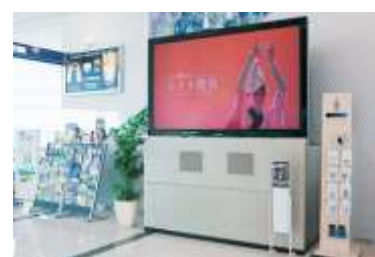
情報提供スペースのイメージ