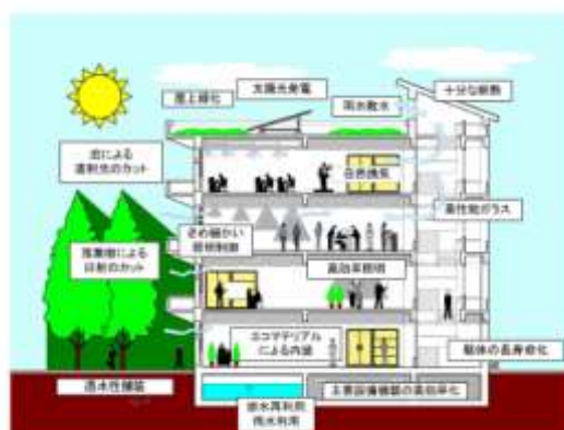
グリーン庁舎のイメージ