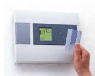
入退室管理のイメージ

(注1) サージ機能：情報通信機器などを、雷などにより生じる過渡的な異常高電圧やその結果により生じる異常大電流などから保護する機能