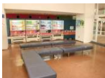
自販機コーナーのイメージ