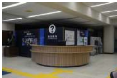
総合案内のイメージ