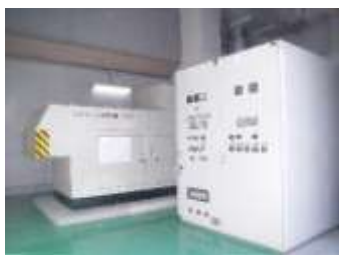
自家発電設備のイメージ