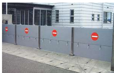
浸水防止壁のイメージ