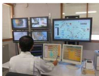
管理システムのイメージ