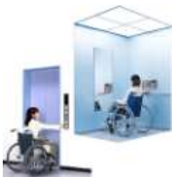
車いす対応EVのイメージ