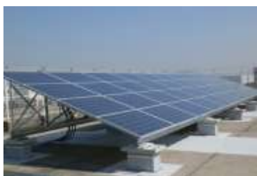
太陽光発電のイメージ