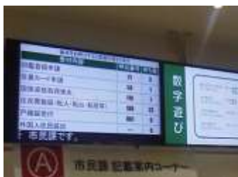
電光掲示板のイメージ