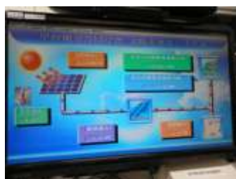
太陽光発電のイメージ