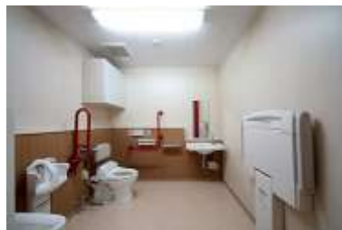
多機能トイレのイメージ