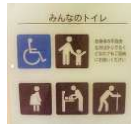
ピクトグラムのイメージ