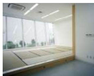
休養室のイメージ