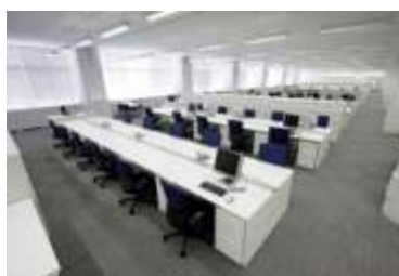
執務室のイメージ