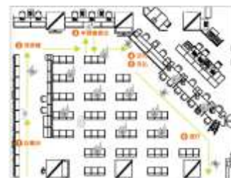
ワンストップサービスのイメージ