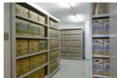
備蓄倉庫のイメージ