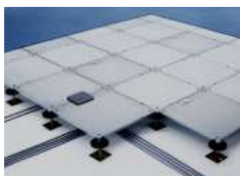
フリーアクセスフロアのイメージ