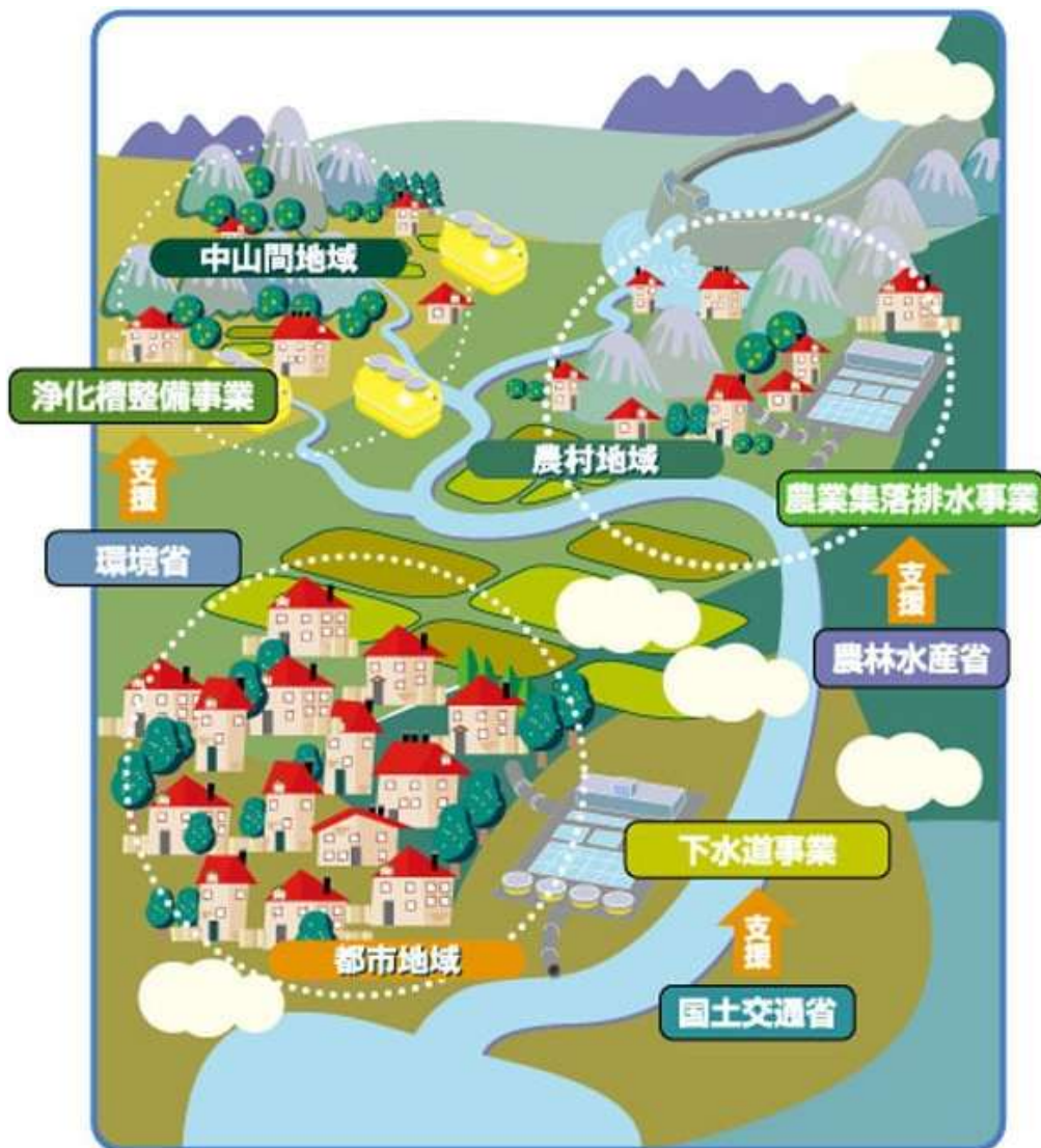
図 1.1 生活排水処理施設の整備イメージ