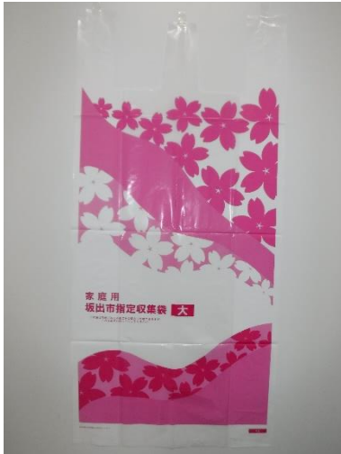
坂出市指定收集袋（用于可燃垃圾和不可燃垃圾）