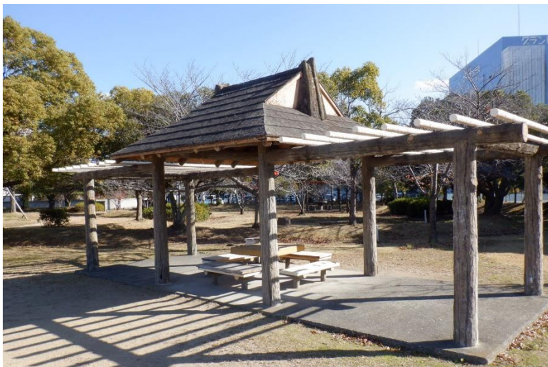
パーゴラ（屋根あり）