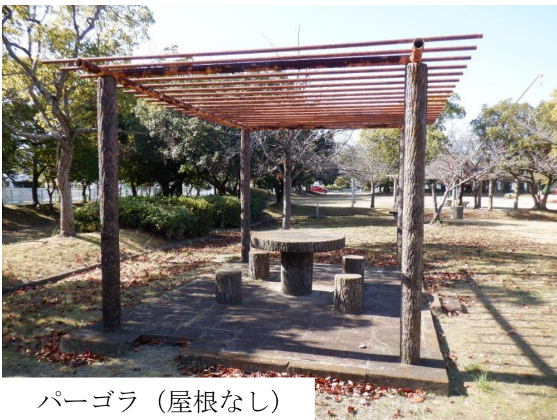
パーゴラ（屋根なし）