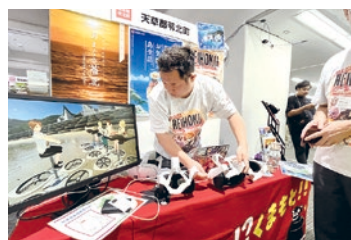
VRを活用した 現地視察プログラムの様子

都会と比較して、特に「コスト」「自然」「アクセス」といった点で坂出市に魅力を感じただけのかたが多く、駅前再開発への期待も大きい印象でした。また、家庭菜園など、都会では難しい趣味を移住先で楽しみたいというかたもいて、多くの人が「自分らしい暮らし」を求めて移住を検討されていたことが印象的でした。