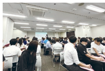
勉強会では全国の相談員と情報交換

都会と比較して、特に「コスト」「自然」「アクセス」といった点で坂出市に魅力を感じただけのかたが多く、駅前再開発への期待も大きい印象でした。また、家庭菜園など、都会では難しい趣味を移住先で楽しみたいというかたもいて、多くの人が「自分らしい暮らし」を求めて移住を検討されていたことが印象的でした。