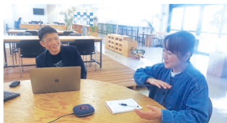
内田さんの相談の様子