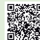
坂出市医師会 ホームページ