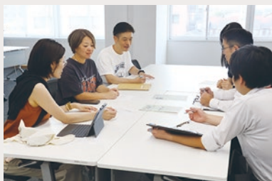
毎月の業務報告会の様子

張ろう、踏ん張ろう」の精神でやってみたら、楽しいことばかりでした。今は、ずっとこのわくわくが続いてほしい、ずっとお店を続けたいと思っています」