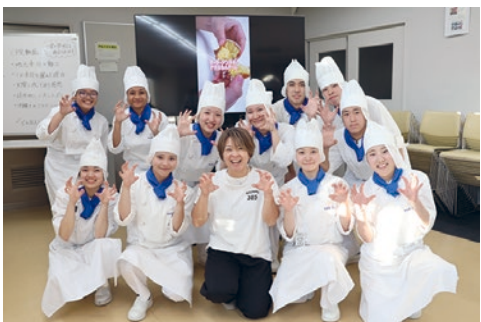
上：坂出産のサツマイモを使用した沖縄の郷土料理 中：パル in SAKAIDEや酒出駅などのイベントに出店 下：坂出第一高校食物料とタッグを組み、坂出の食材を使用したサーターアンダギーを開発