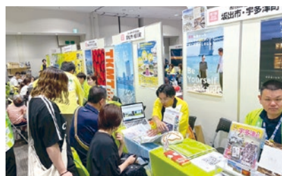
坂出市ブースでの相談対応の様子

全国の市区町村が参加する中、香川県も多くの市町が出展しており、坂出市はお隣宇多津町とブースを分け合う形で移住相談の対応を行いました。