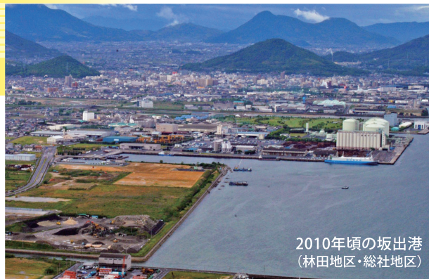
2010年頃の坂出港 (林田地区・総社地区)

坂出港が環境にやさしい港として大きく変化する中、このエリアも今後さらに変化していくことが期待されます。