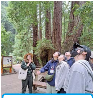
8.1 ミュアウッズ国立公園