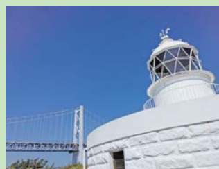
協会特別賞 「blue & white」 Potographer 様（坂出市）