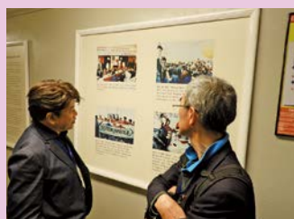
7.27 ゴールデンゲートブリッジにて提携当時を振り返る

活気ある街と熱意溢れた市民の皆さんに触れ、35年の絆を誇りに思うとともに、久々の対面で、交流の益々の発展を共に誓い合う、実りの多い訪問となりました。