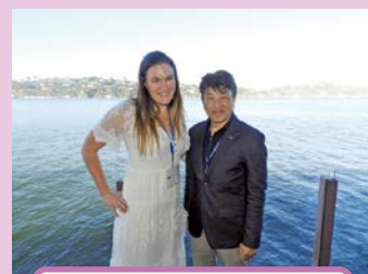
ブラウスタイン市長と