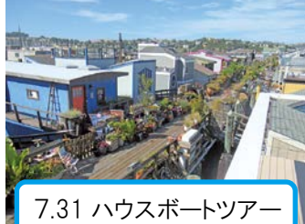
7.31 ハウスボートツアー