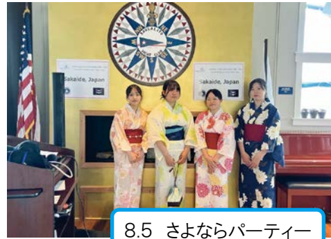
8.5 さよならパーティー