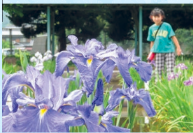
@かわつ花菖蒲園 さんぽ♪ (春夏秋冬) (沖部屋 綾さん)