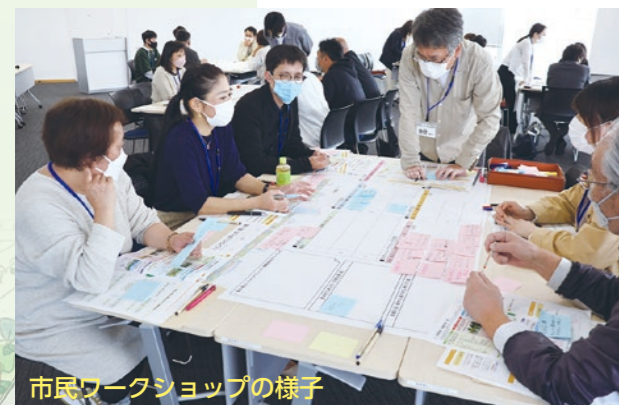
市民ワークショップの様子