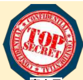
審査員 商工会議所