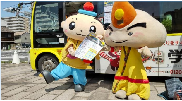
〇4/16(日)坂出駅前楽市楽座でのPR…琴参バス