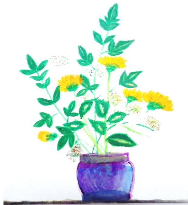
＜ 乃村 正和 ＞

問1：なら(奈良)・さが(佐賀)・あいち(愛知)・あいち(愛知) 問2：①夫婦 ②カッパ ③豆腐 ④きつね ⑤ベース