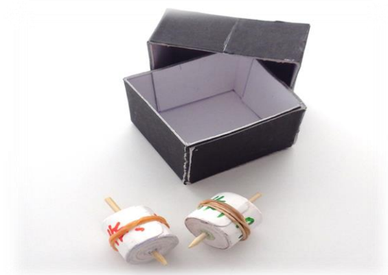
《今治 良廣 様》