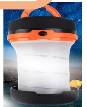
折り畳み ランタンライト