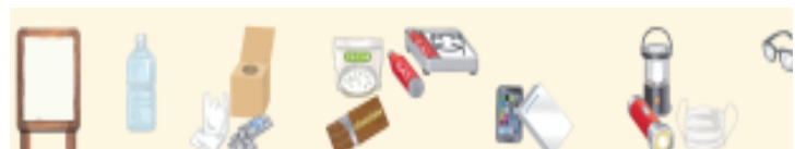
オリジナルマスキングテープ