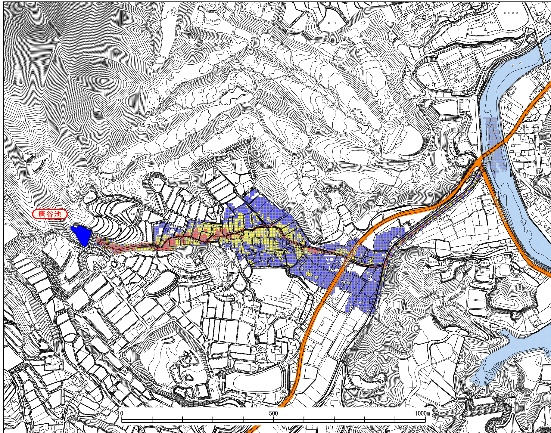
坂出市ため池氾濫解析 浸水想定区域図 (歩行困難区域)