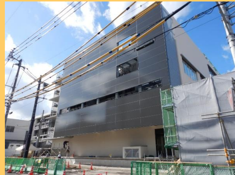
黒い部分が室外機置き場を覆うパネルです(東面)。