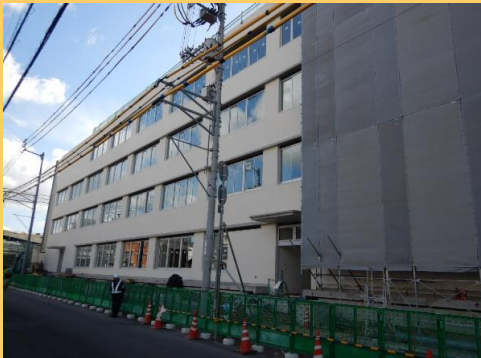
外壁がよく見えるようになりました(北面)。