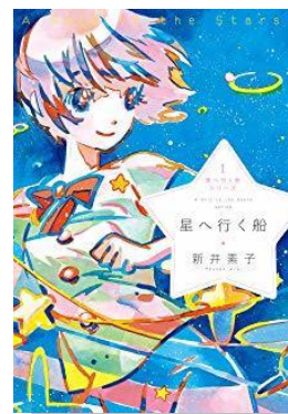
『星へ行く船』新井素子/著 出版芸術社(F アラ)