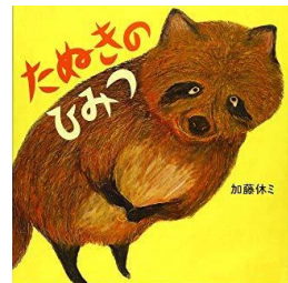
『たぬきのひみつ』 加藤休ミ/作 文溪堂 (E カト)