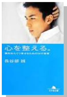
『心を整える。』長谷部誠/著 幻冬舎(726/ハセ)