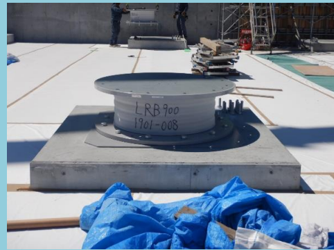
免震装置が設置されました。