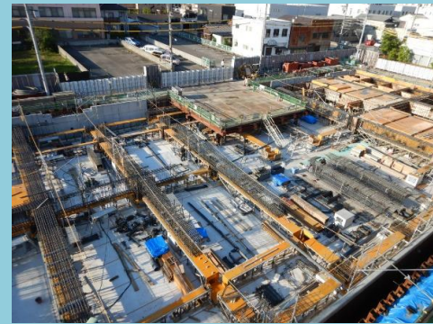
1階床部分の梁の配筋をしています。