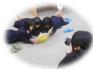
↑撮影風景 ←こんなきゅんとくる場面も