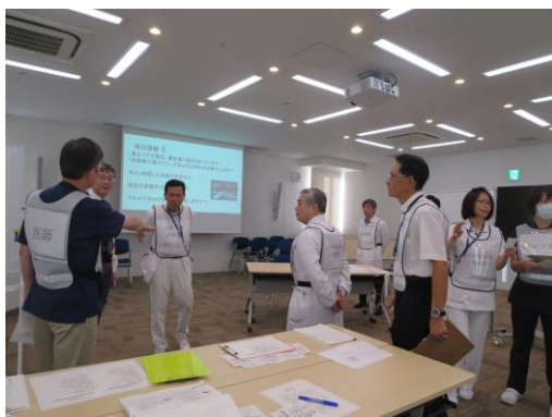
災害対策本部 情報収集や指揮命令の中枢になります。