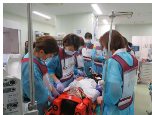
救急部門 (特に重症な方を収容します)