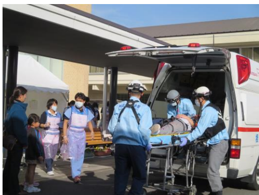
救急隊も参加し、本番さながらの訓練になりました。