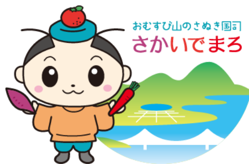
坂出市公認キャラクターさかいでまる