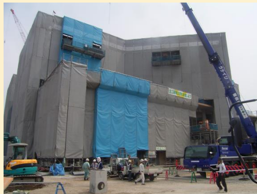
外観写真(病院南西より撮影)