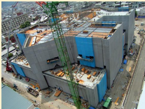
全体写真(病院北西より撮影)