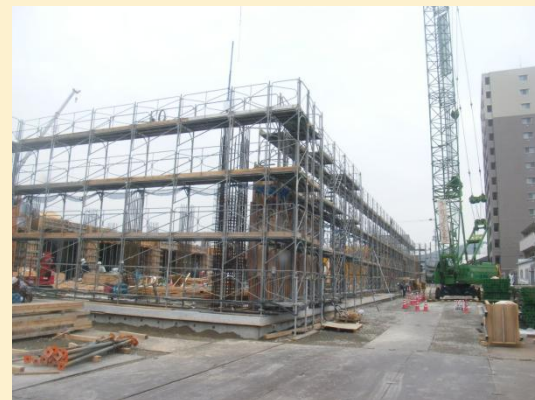
外部足場組立状況