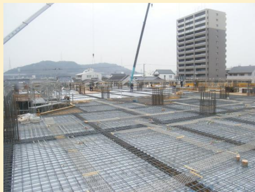
1階天井部分のコンクリート打設