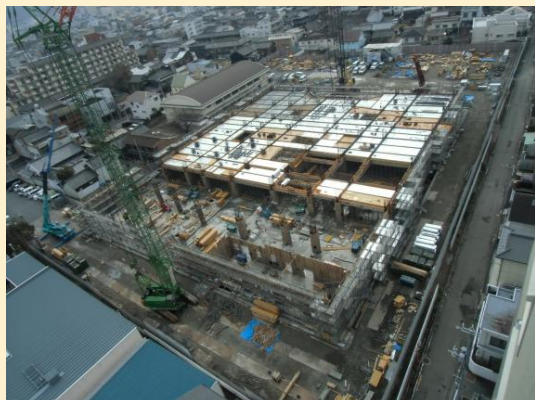
全体写真(病院北西より撮影)