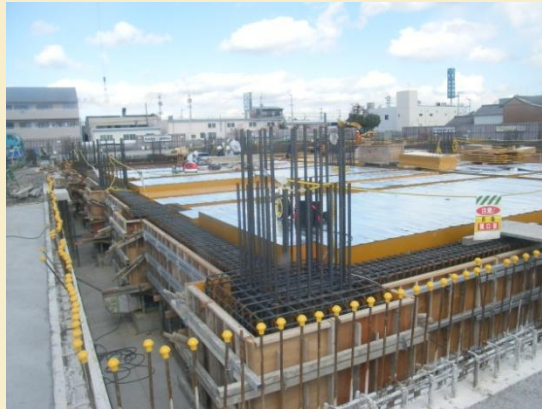
病院南西側からの現場写真