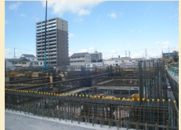
病院南東側からの現場写真