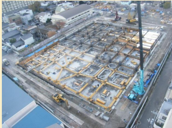
全体写真(病院北側より撮影)