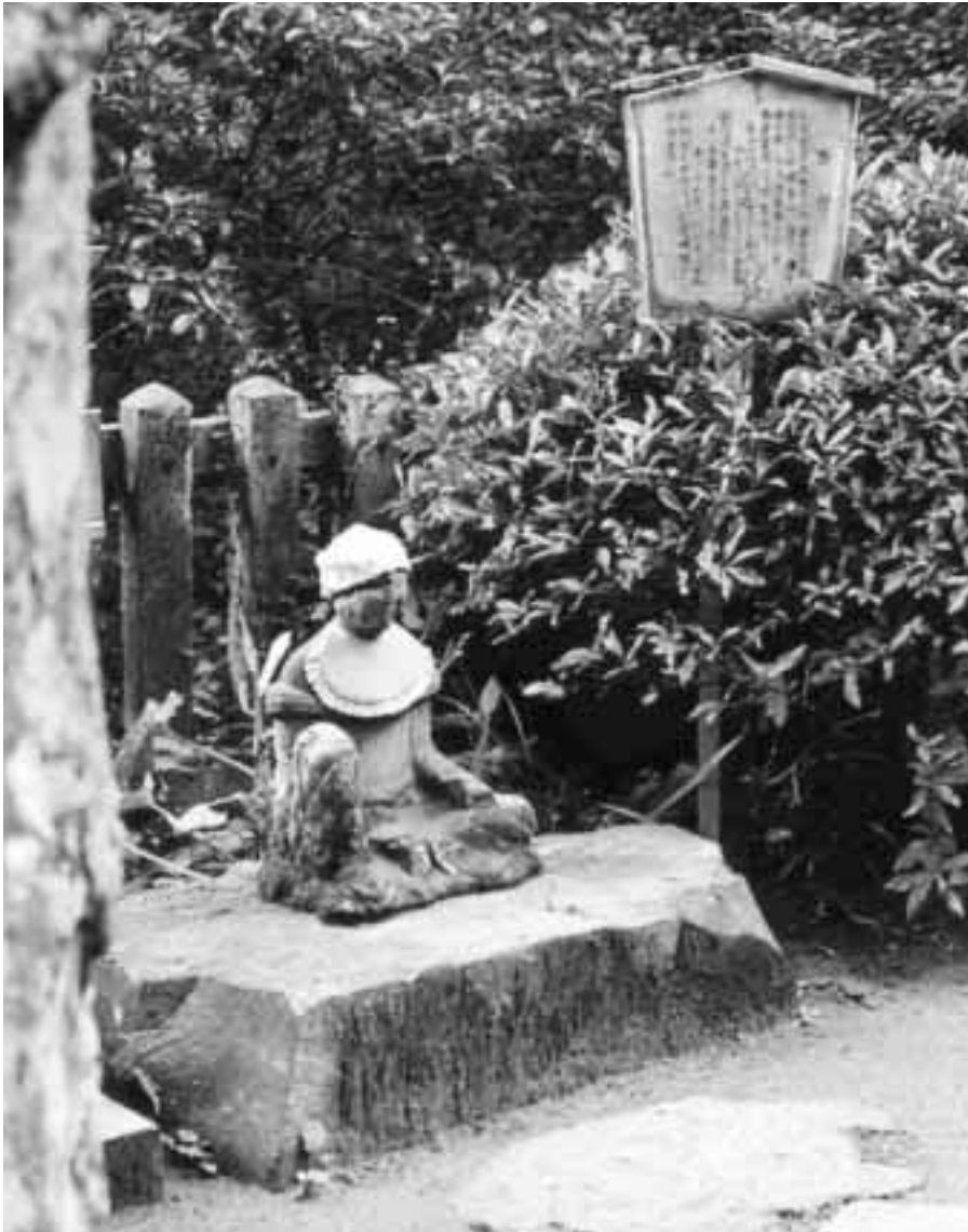
▲歌人らしく、歌膝を立て歌を詠む「西行法師」の石像（頓証寺殿横）