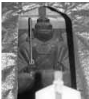
▲頓証寺殿の相模坊天狗像