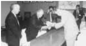
▲ライオンズクラブ国際財団・坂出ライオンズクラブ・坂出白峰ライオンズクラブによる義援金等贈呈式