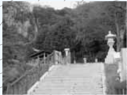
新道の終点付近の石段から望む 稚児ヶ滝