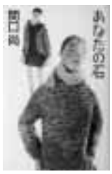
あなたの石 関口 尚 著