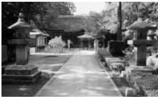
▲頓証寺殿（白峯寺境内）