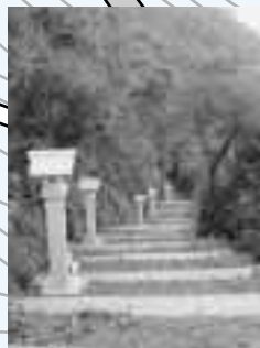
旧道の石段と石灯笼