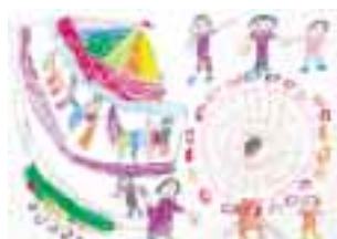
(おうちのみんで すまのゆうえんちへいつて たのしかったよ)