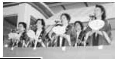
▲坂出小唄の熱唱で総おどりを盛り上げた坂出民踊連合会のみなさん。

新しい試みとしては、C1グランプリ、ストリートダンス、パチッコライブ、また2年に1度のミスさかいでのお披露目、昨年雨天中止のため2年ぶりとなった総おどりなど話題も多く、市民総参加で燃えた真夏の祭典でした。期間中の人出は、参加者を含めて約129,900人。