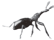
アリモドキゾウムシ (大きさ約6mm)