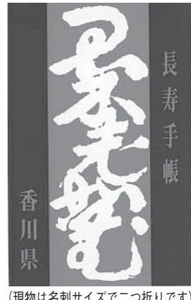
(現物は名刺サイズで二つ折りです)