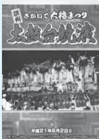
2009年太鼓台競演カレンダー 発売中 (500円)

午前8時30分～午後3時30分 太鼓台競演(駅前ハナミズキ広場周辺) 午後6時～9時