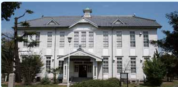
坂出市郷土資料館(寿町一) (坂出市指定有形文化財)