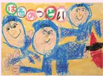
にんじゃになっておどったよ!