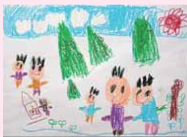
みんなでおさんぽにいったよ