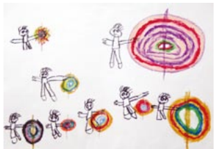
たくさんコマがまわったよ