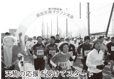
天狗の応援を受けてスタート