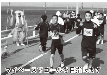
マイペースでゴールを目指します