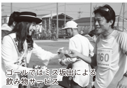
ゴールではミス坂出による飲み物サービス