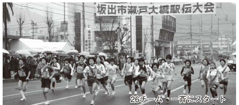
26チーム 一斉にスタート