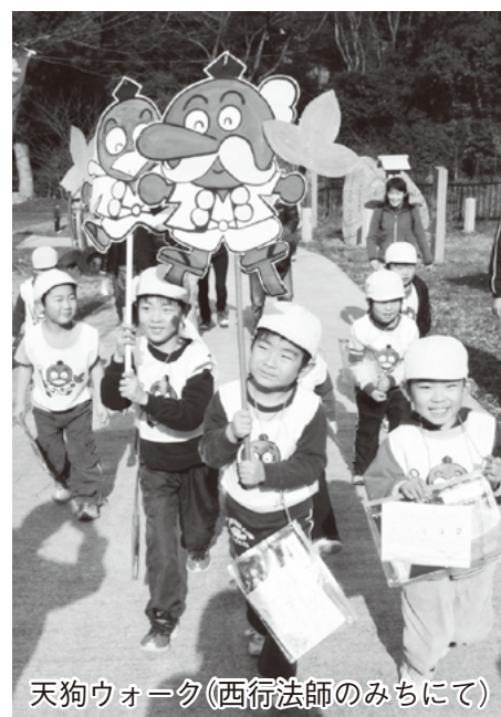
天狗ウォーク(西行法師のみちにて)