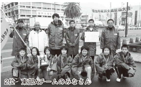
2位 東部Aチームのみなさん