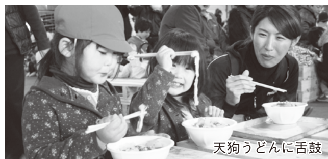
天狗うどんに舌鼓

2月7日は、天狗ウォーク、相模坊まつり、8日には第15回天狗マラソン大会とステージイベントが開催されました。天狗ウォークの参加者は、松山小学校を出発し、白峯寺までの往復10.9kmを楽しみました。天候に恵まれた天狗マラソンでは、15kmの部に614人、5kmの部に360人が参加し、それぞれのペースで臨海コースを走りました。2日間を通して振る舞われた名物「天狗うどん」は5,800食。みなさんは、10種類の具をすべて言えますか？