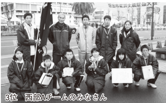
3位 西部Aチームのみなさん