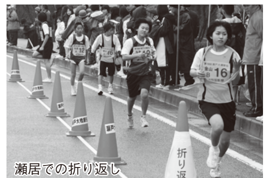
瀬居での折り返し