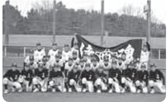
白峰中学校 野球部

僕たち白峰中学校野球部が目標にしているのは、大会優勝だけではなく、あいさつや礼儀といった、人としてのマナーを身につけることです。