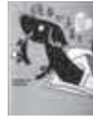
絵本で子育て 秋田喜代美著