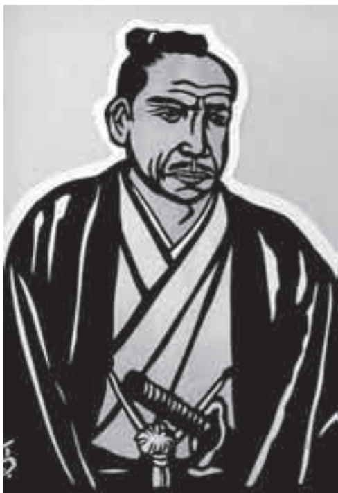
久米栄左衛門通賢翁

歴史の再認識をテーマに香川に伝わる民謡、わらべ歌、塩田の作業唄と日本の四季の曲、世界の四季の曲等が演奏されるコンサートです。