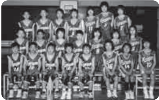
金山ミニバスケットボールスポーツ少年団

私たち金山ミニバスケットボールスポーツ少年団は、金山小学校体育館で火・木曜日は午後5時から、土曜日は正午から約3時間練習しています。