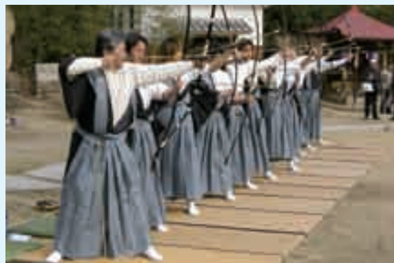
櫃石ももて祭(櫃石) (県指定無形民俗文化財)

ももて祭とは、神様の名前などを唱えながら的に向かって矢を放ち、その年の豊作、豊漁や厄よけを祈願する神事です。1日がかりで行われ、1人で100手(1手2本)前後もの奉射を行うことから、「百手」祭と呼ばれています。