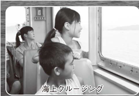
海上クルージング

まつりのオープニングを飾った瀬戸大橋パレードをはじめ、躍動感あふれる踊りの自由連や総勢約3,300人の踊り手による総おどり、坂出の夜空を美しく彩った海上花火大会、海上保安庁巡視艇による海上クルージング、11台の勇壮な太鼓台による太鼓台競演等、今年も天候にも恵まれ予定されていた行事はすべて無事に終了しました。