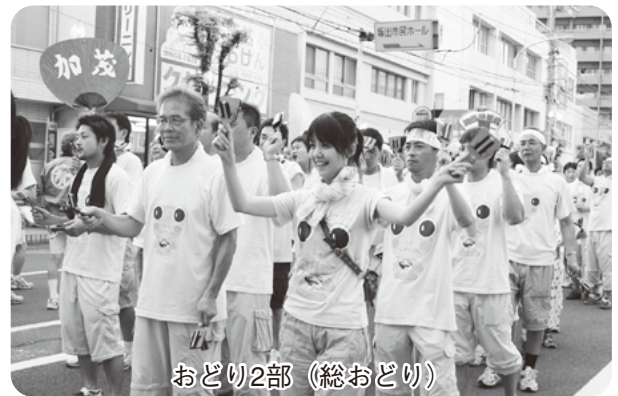
おどり2部 (総おどり)