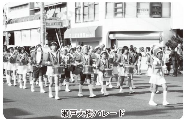
瀬戸大橋パレード