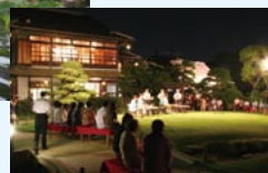
こうふうえん 香風園 すいしょうかく 附翠松閣・時雨亭 (本町一) (市指定文化財)