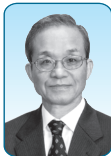
しのはら こういち 篠原 光一 議員