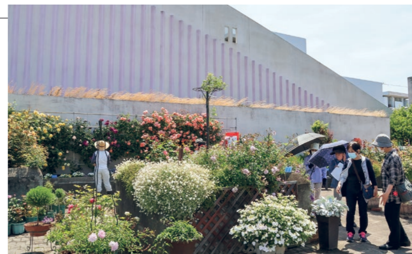
◀ 坂出人工土地屋上バラ園

市職員による防災チーム「さかいで131（ぼうさい）おとめ隊」第10期メンバーの任命式が行われました。今年度で活動10年目を迎え、これまでの成果や課題を振り返りながら、女性の視点から、職員や市民に向けて日常的に取り入れられる防災・減災の啓発に努めていきます。