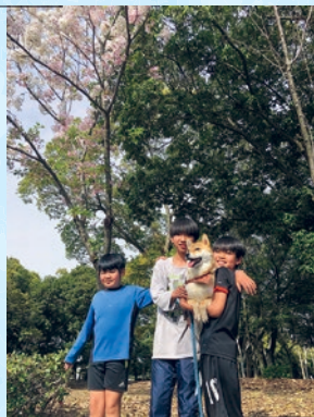
@東大浜公園 綺麗な桜満開の下で子供と愛犬で撮影 (みかたんさん)