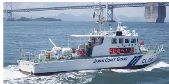
図 〒762-8601 坂出市室町2-3-5 市港湾課内坂出港振興協会事務局(☎44・5010)