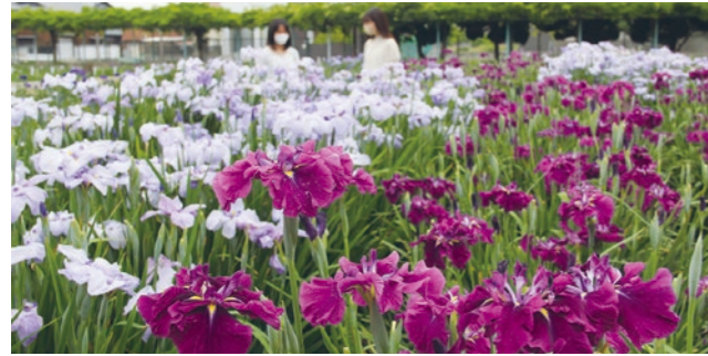
図 市産業観光課(☎44・5103)