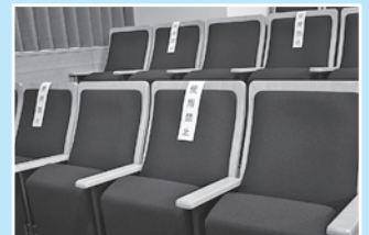
傍聴席は間隔を空けてお座りください。

※本会議（一般質問）は香川テレビ放送網（KBN）またはインターネット配信のご視聴にご協力をお願いします。