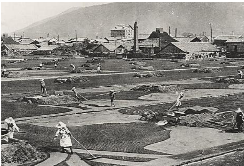
◀塩田風景(昭和初期)▶