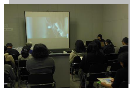
【さぬき庵治石ガラス講演会】