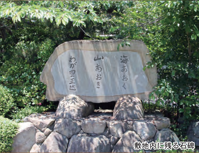
敷地内に残る石碑