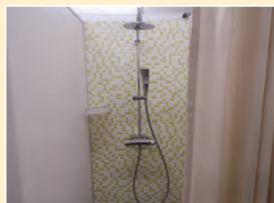
▲シャワー室 (ブース内)