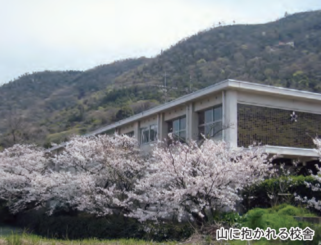
山に抱かれる校舎