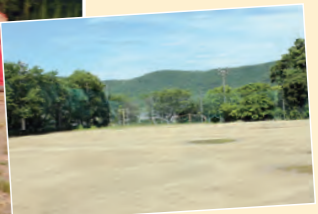
▲運動場で レクリエーション