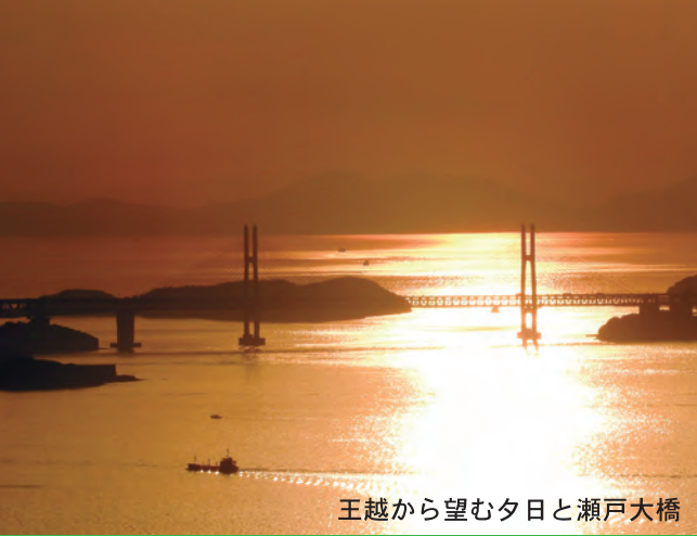
王越から望む夕日と瀬戸大橋