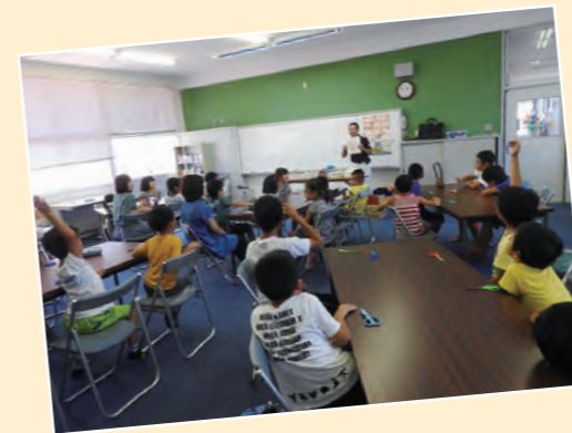
▲トンボ学校の開校