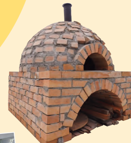
▲ピザ窯で本格ピザ作り