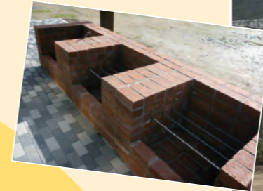
▲バーベキューも できます